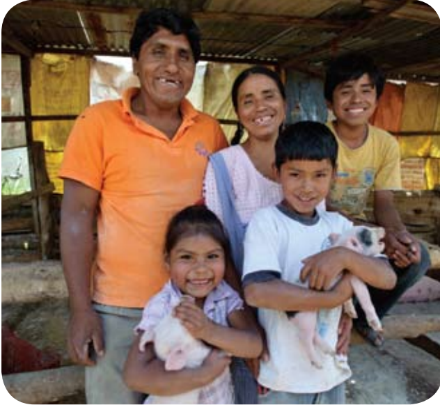
Una familia boliviana disfrutando el tiempo juntos.

6. Círculo de cuidado incluye actitudes, valores, comportamientos y prácticas tradicionales positivas y protectivas; y un ambiente social inmediato de cuidado, apoyo y protección.