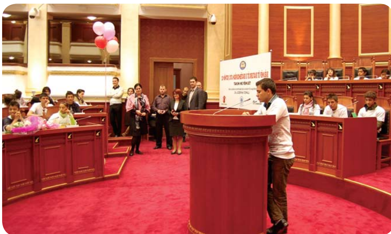
Niños/as albanos dirigiéndose al Parlamento, al gobierno y a los medios, en relación a los derechos infantiles y a la necesidad de una legislación protectora adecuada.