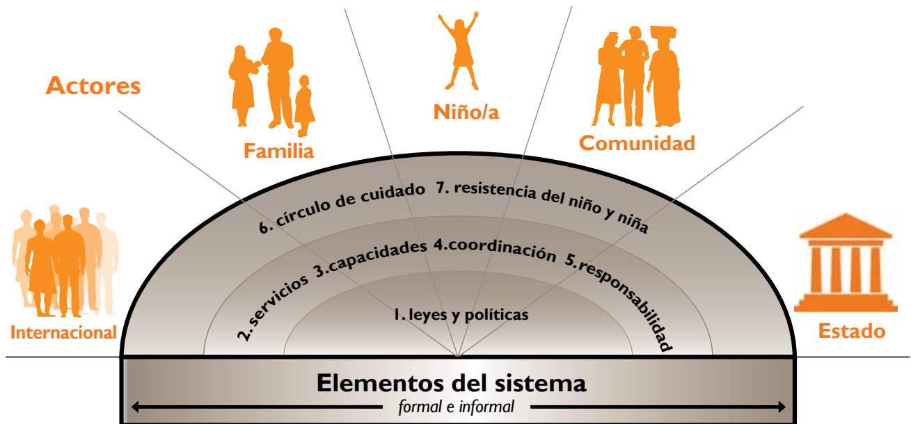
Figura 1: Los siete elementos y los cinco tipos de actores principales del sistema de protección infantil

El entendimiento de un sistema de protección infantil de Visión Mundial consiste de siete elementos y cinco tipos de actores principales: