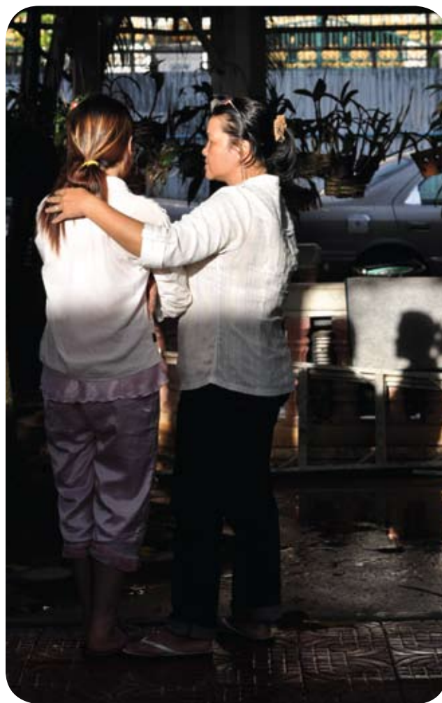
Niña camboyana, quien fue objeto de explotación sexual comparte sus sentimientos con una trabajadora social.