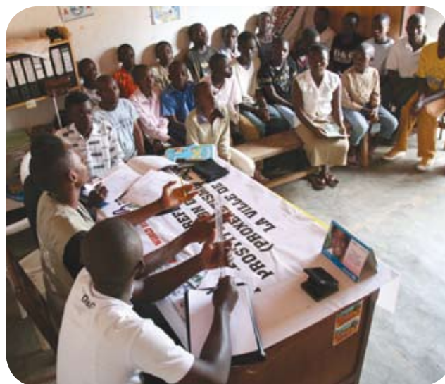
Parlamento infantil en la República Democrática del Congo del Este.