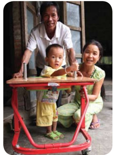
Una familia en Vietnam celebra el éxito de su hijo.