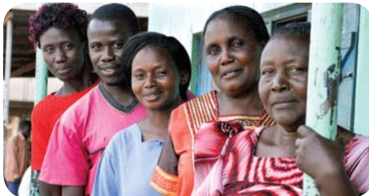
Miembros del Comité de Protección Infantil en Uganda.

En las comunidades, los elementos formales e informales entran en función y su combinación dependerá del contexto en particular. En los lugares donde el sistema de gobierno está descentralizado, la presencia de los elementos formales del sistema como las fuerzas del orden público especiales pueden ser mayores. En otros contextos, los elementos informales pueden ser dominantes. Por ejemplo, en muchas comunidades donde trabaja Visión Mundial, existen comités de protección infantil informales, clubes juveniles u otras estructuras que realizan funciones de prevención y protección. Este nivel incluye a la mayoría de las organizaciones de la sociedad civil, así como a los negocios. Los miembros de la comunidad también tienen importantes roles que desempeñar en la protección infantil, ya sea como vecinos, mentores, amigos y otras figuras positivas. Estando unidos los miembros de la comunidad y las familias también tienen un papel importante en el desarrollo de activos que ayuden a los niños y las niñas a luchar mientras que previenen el abuso, la negligencia y la explotación.